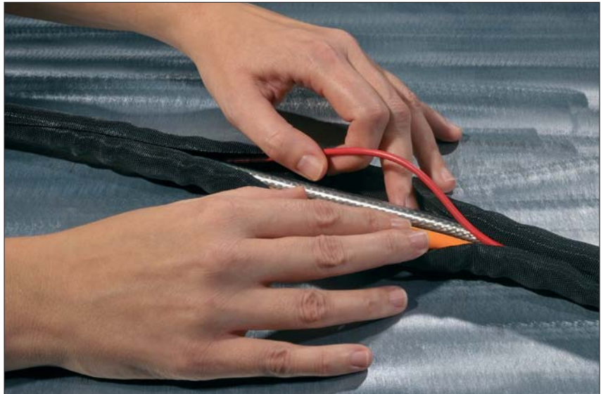
Mit Helagaine Twist-In bleiben Kabelbündel leicht zugänglich für Wartung, Reparatur und Inspektion.

Helagaine Twist-In findet Verwendung bei der Fertigung von industriellen Maschinen, Elektronik und Elektrotechnik.