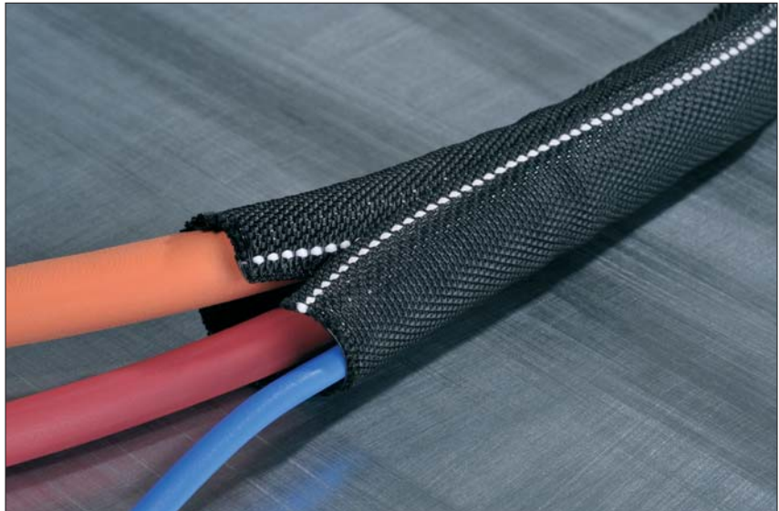
Helagaine Twist-In-FR kann leicht am weißen Kennzeichnungsfaden identifiziert werden.

Helagaine Twist-In-FR ist selbstverlöschend nach UL 94 V0. Er eignet sich vor allem für Bereiche, in denen hohe Anforderungen an den Brandschutz gestellt werden, wie bspw. Schienenfahrzeugbau, Luftfahrt und Schiffbau.